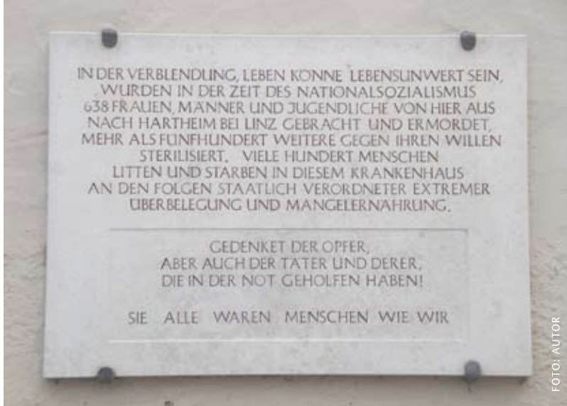
Abb. 7: Gedenktafel im Bezirksklinikum Regensburg zum Andenken an die deportierten Menschen aus Karthaus-Prüll; Anmerkung: die Zahl 638 wurde später auf 641 nachkorrigiert.

wusst wahrnehmen und ansprechen – Widerstand: Möglichkeit und Gefahr zugleich – auch für Schülerinnen und Schüler?