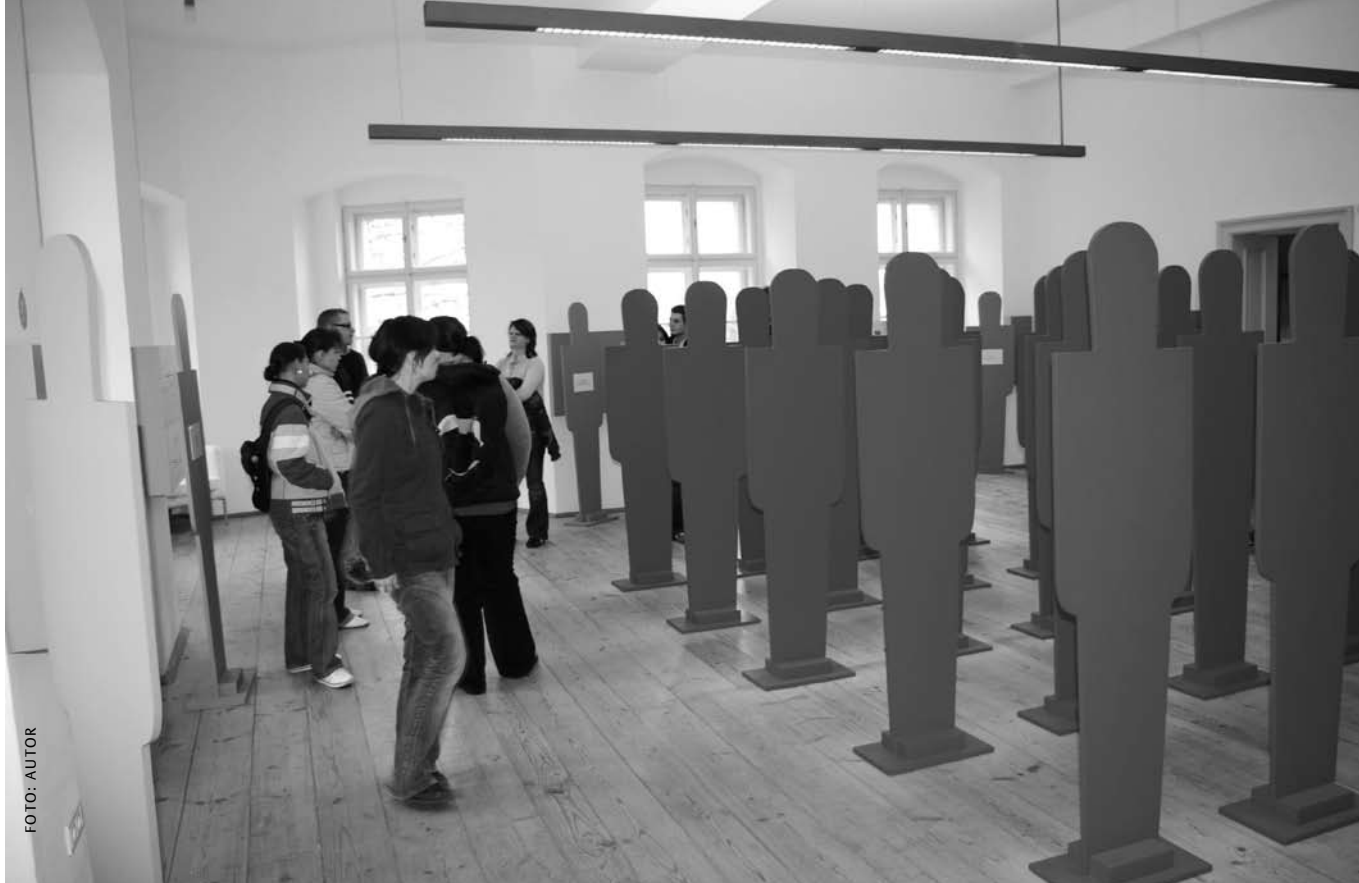
Abb. 6: Ausstellung „Wert des Lebens“, Hartheim.

auf, um Ruhe zu finden. Wir treffen uns nach einer Pause in der Gruppe in einem der Seminarräume. Es bleibt Zeit, das Erlebte aufzuarbeiten, zu diskutieren und Parallelen zur Jetztzeit zu ziehen. Die Lernenden bringen Beispiele aus ihrer Einsatzpraxis in den Kliniken. Es wird Kritik geübt am System, das den Menschen auf seine Diagnose und standardisierte Behandlungszeiten reduziert. Es werden kritische Stimmen laut, die die Rationierungsmaßnahmen des Gesundheitswesens betreffen. Eine Lernende stellt die provokative Frage: „Und ab wann bekommt man eigentlich kein künstliches Hüftgelenk mehr?“