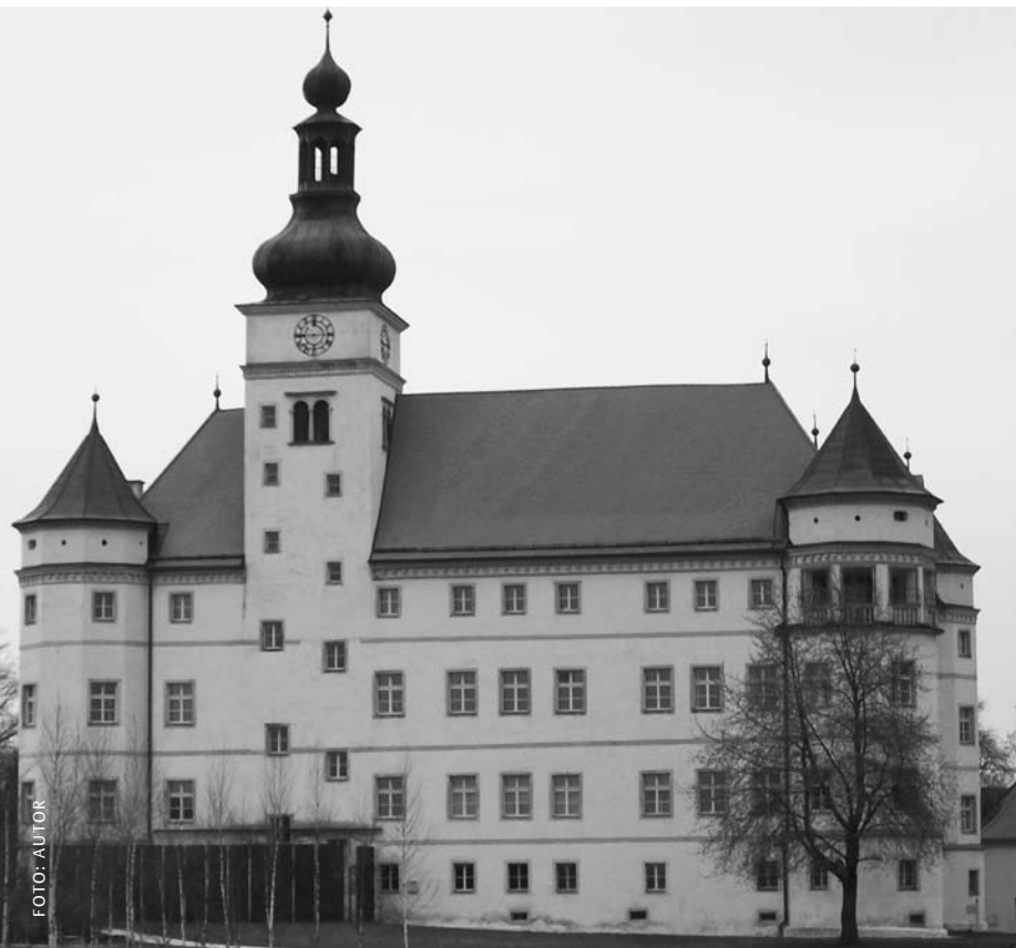
Abb. 4: Schloss Hartheim in Alkoven/Oberösterreich.

Anschließend geht es wieder in die Freiarbeitsphase für die Lernenden. Das bisherige Wissen wird vertieft, bislang unbekannte Informationen aus dem Fachvortrag werden ergänzt. Zu Expertensprechstunden stehen weiter zwei Fachpflegende aus der psychiatrischen Klinik bereit, die Arbeiten zum Thema Psychiatrie und Nationalsozialismus vorgelegt haben, eine Pflegedienstleitung, die Anfang der Neunziger Jahre noch Interviews mit Zeitzeugen aus der Pflege führen konnte (Mithilfe bei der Zwangssterilisation, Arbeit auf Stationen mit Hungerkosterlass und Schilderung der Abtransporte nach Hartheim) stellt Ihre Facharbeit zur Verfügung. In kurzen, obligatorischen Kurzpräsentationen legen die Gruppen ihren Arbeitsprozess und ihre bisherigen Ergebnisse bei der Projektleitung dar. Somit kann eine individuelle Beratung der Arbeitsgruppen sichergestellt werden. Nachmittags besteht auch für die übrigen Gruppen noch einmal die Möglichkeit, das Archiv zu besuchen (wie Tag 1).